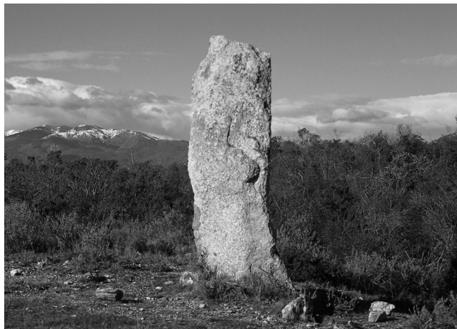
Menhir de Vilartolí (Sant Climent Sescebes)