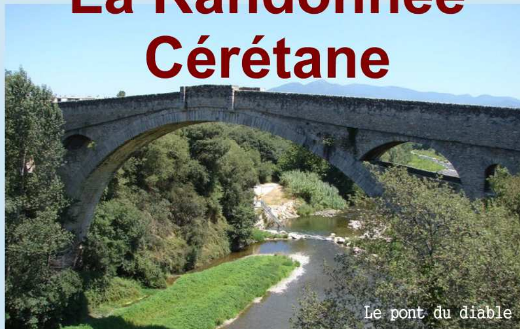
Le pont du diable