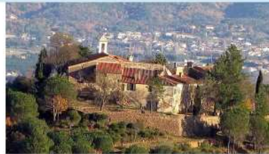
Ermitage St Ferréol