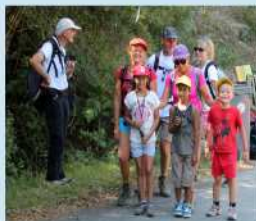
La relève ?

Créée en 1985, La Randonnée Cérétane, adhérente à la FFRandonnée des Pyrénées Orientales, propose chaque semaine des randonnées pour tous les niveaux de marche. Soutenue par la municipalité de Céret et le Conseil Départemental, elle participe à l'entretien des GR® du département et des PR de la communauté de communes du Vallespir.