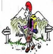
Chapelle St Paul