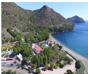
VILLAGE DE VACANCES