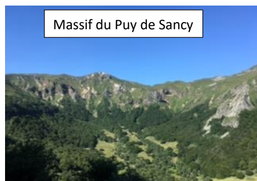
Massif du Puy de Sancy