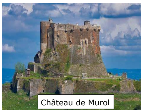
Château de Muro

Séjour en pension complète 6 jours : 520 € sur base de 20 participants .