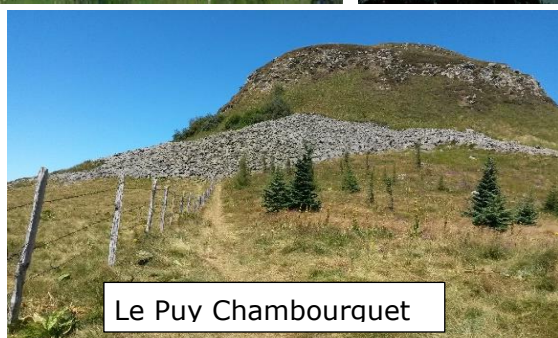
Le Puy Chambourquet