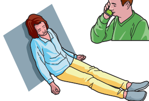
ou position assise si difficulté respiratoire