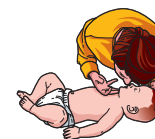
Position neutre pour le bébé

30 compressions thoraciques, 100 à 120/min suivies de 2 insufflations. Répéter ces cycles.