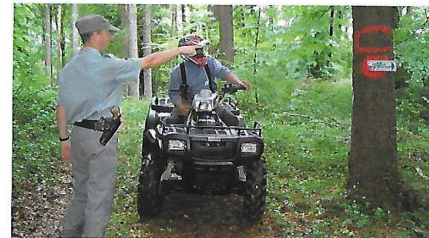
En forêt, la circulation est réglementée par le Code Forestier.