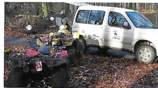
Les contrevenants s'exposent à des sanctions lourdes et à l'immobilisation de leur engin.