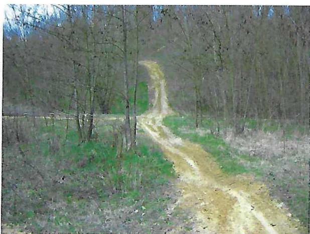
La circulation hors des zones autorisées n'est pas sans conséquences sur les espaces naturels.

Afin de concilier protection de la nature et activités humaines, la circulation des véhicules à moteur est réglementée.