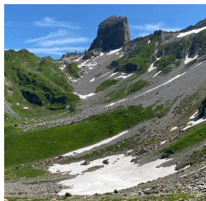
LA ROCHE PARSTIRE